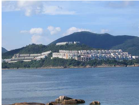
Prisão Stanley, Hong kong.

como a Perseverance Lodge No. 1165 EC funcionaram em campos de prisioneiros (Prisão Stanley/ Stanley prison). Ainda hoje existe o Livro da Perseverance Lodge No. 1165 com atas do período.