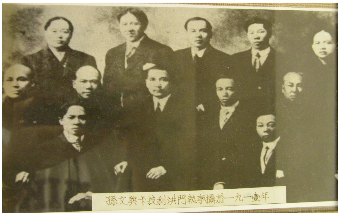
孫中山與卡加利洪門執事 (1911)

negociações com os dirigentes do norte da China em uma tentativa de reunificação nacional.