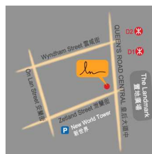
Edifício New World Tower.