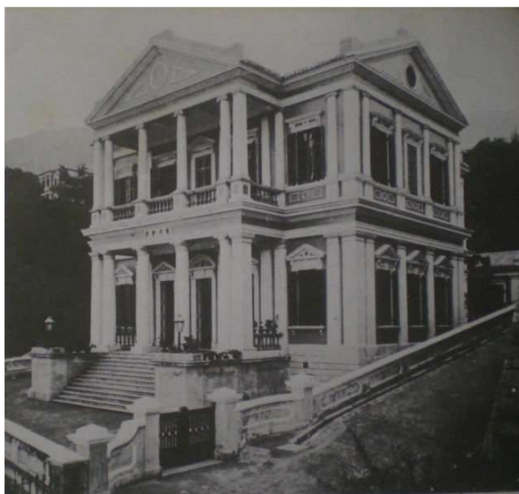
Zetland Lodge No. 525.

Hong Kong em 1952. A segunda Loja, Zetland Lodge No. 525 EC foi fundada em 21 de março de 1846.