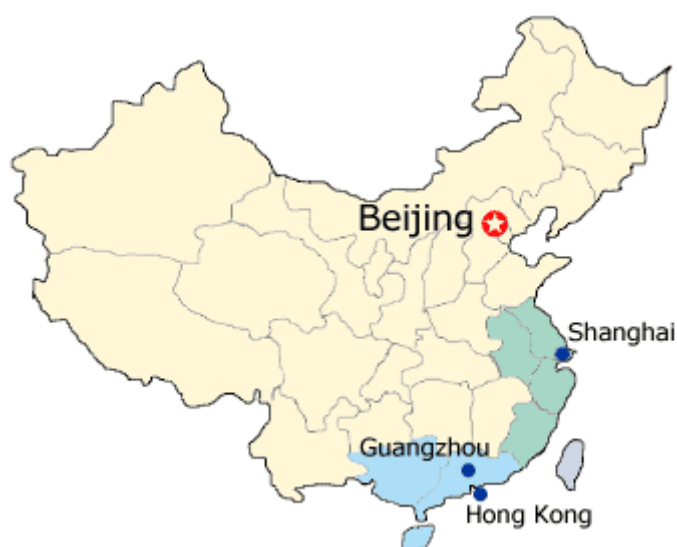
Cantão (Guangzhou) na China.

Registros da Grande Loja da Inglaterra mostram que a Loja Amity No. 407 realizava sessões em Cantão (Guangzhou), porém elas terminaram no final do século. Duas Lojas se estabeleceram em Hong Kong logo após os Britânicos terem adquirido o território. A Mais antiga chamada Royal Sussex Lodge No. 501 EC (nome em homenagem ao Duque de Sussex, que foi Grão Mestre da Maçonaria Inglesa) fundada em 18 de Setembro de 1844. Posteriormente ela transferiu-se para Guangzhou, depois para Shanghai e somente retornou para